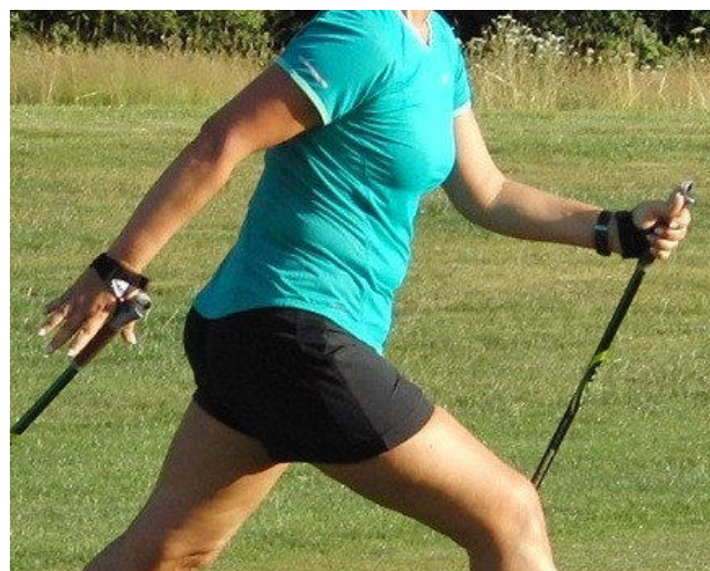
Stockführung und Griffhaltung

Der Bewegungsablauf, die Trainingsintensität, die Ausrüstung, die funktionelle Technik, all das sollte zusammenpassen.